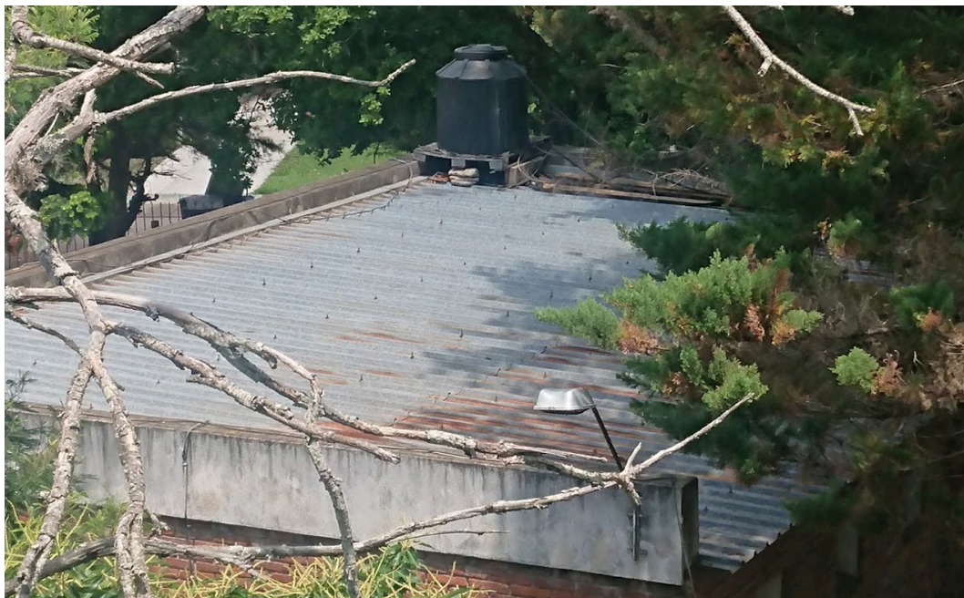
Cubierta comedor estudiantil.

Importante: se deberá garantizar la estanqueidad de la cubierta. Podrá realizarse, en caso de que la Supervisión de Obra lo considere, la prueba de estanqueidad correspondiente. La prueba consistirá en el rociado de la cubierta con agua simulando el agua de lluvia. La observación de la cubierta durante 20 o 30 minutos para comprobar si hay filtraciones o gotas de agua que indiquen un problema de estanqueidad.