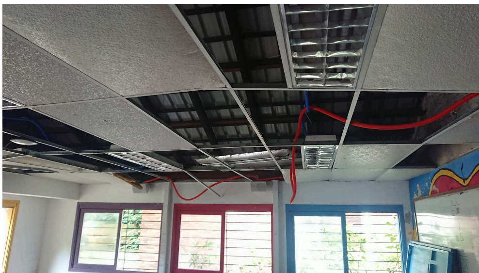
Cielorraso y luminarias a recuperar.

Se deberán colocar las luminarias existentes en la ubicación proporcionada en planos. Las luminarias son existentes, la empresa deberá proporcionar los tubos LED a reponer y cablear la luminaria para la conexión de tubos. Los tubos serán con conexión en un único lado. El cableado necesario irá por encima del cielorraso mediante canalizaciones corrugadas (en caso que sea necesario se deberá reponer).