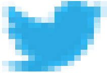
image002.png 730 B