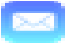
image004.png 706 B