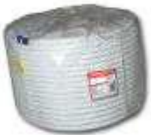
Cuerda de rescate.