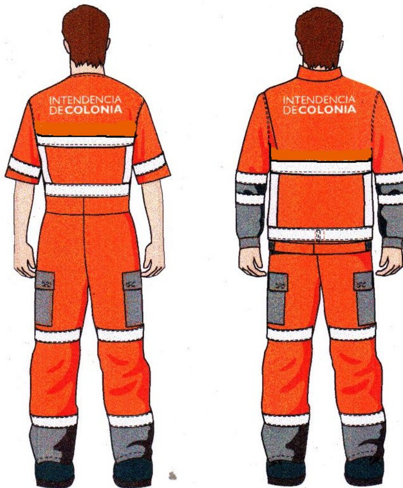
Ropa de Trabajo Intendencia de Colonia ESPALDA